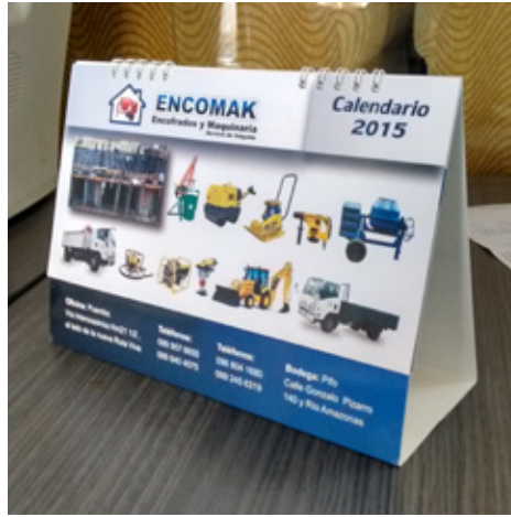
Calendario 15x21cm con anillo segmentado