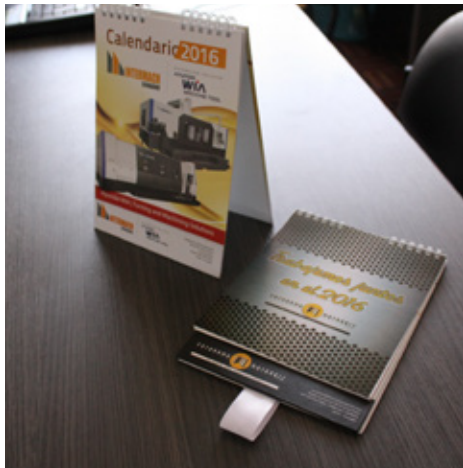
Calendario 15x21cm vertical Pasta dura y cinta inferior.