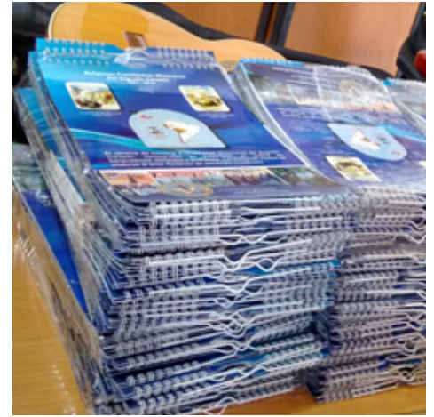
Calendario de pared con colgador Anillado tamaño 21x32cm 6 hojas.